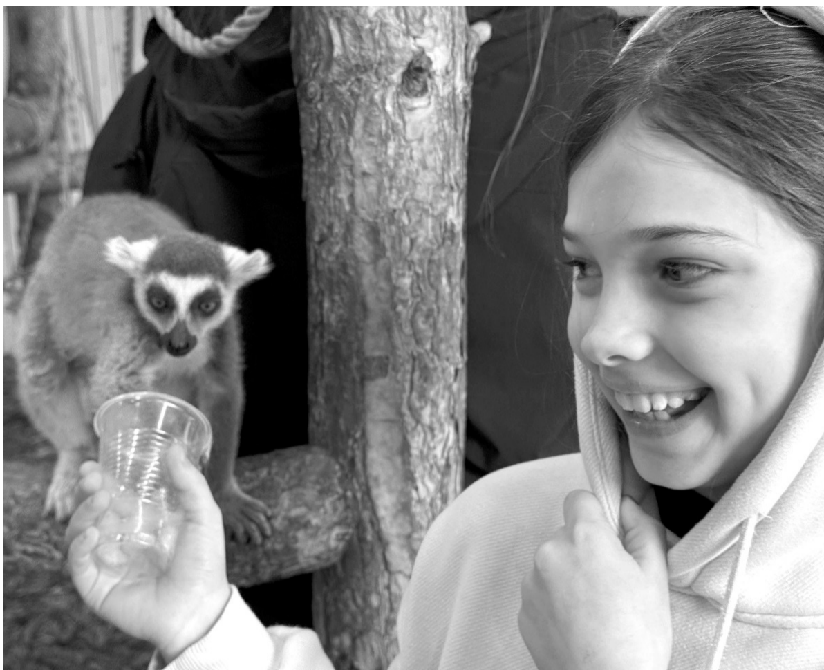
Зоотерапия — важная часть реабилитации детей участников СВО

— Мне очень приятно хотя бы так помогать своим боевым товарищам, их детям, — говорит